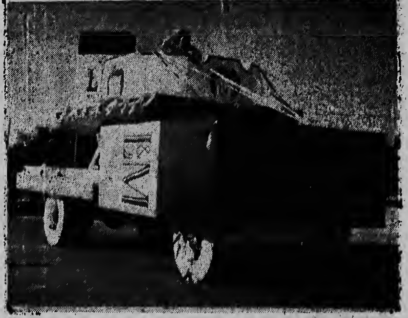
No mon robes nos por mira e auto di Winston, representando un esceno no Arabico, ehecuta artisticamente; cu razon ela gono tambe un premio na San Nicolas; den contra ta kada e auto di Viceray, un obra maestro, di estilo cu smaak y sencilla; na derecha hende par miro e auto di L & M, den un estilo mos rigido, pero tambe meskos bunito. Tur tres e outanan dorna oki par cierto a gana premia. Laga nos